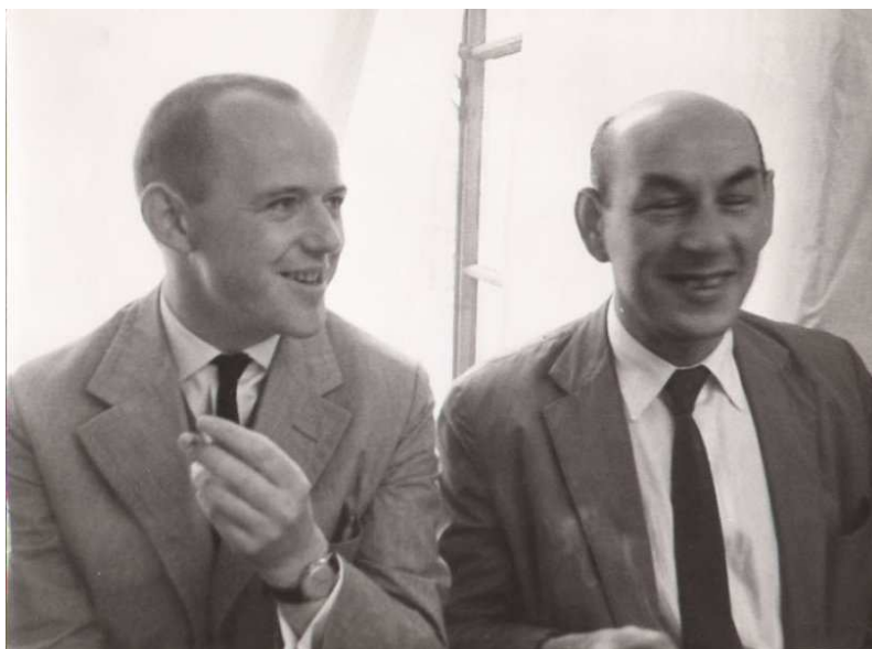
Roman Cieślewicz s Henrykem Tomaszewskim

Od samých počátků své tvorby se rovněž aktivně zapojoval do výstavnictví. Spolupracoval na přípravě polského pavilónu na Lipském veletrhu (1957) nebo na pavilónu Ce-Te-Be na Mezinárodním veletrhu v Poznani (1963). Do konce 50. let se Cieślewicz stal držitelem mnohých významných ocenění. Za svůj celkový přínos v oblasti plakátové tvorby, obdržel cenu WAG Tadeusze Trepakowského. Zúčastňoval se mnoha tématicky zaměřených plakátových soutěží, ze kterých si často odnášel různá ocenění.